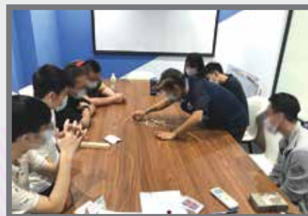
每週體驗不同的桌遊～