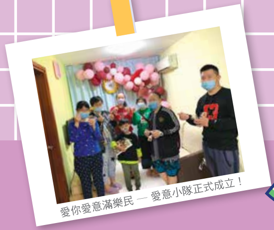
愛你愛意滿樂民 — 愛意小隊正式成立！