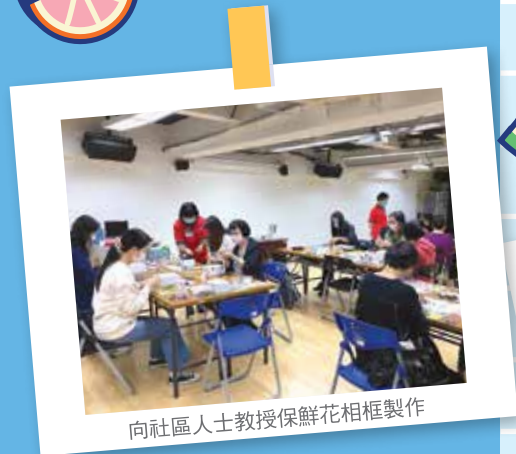
向社區人士教授保鮮花相框製作