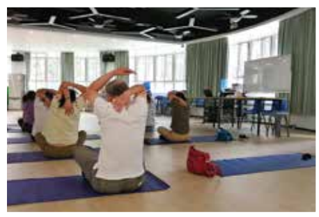
一起做運動伸展，放鬆身心