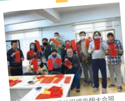
手持給自己的祝福來個大合照