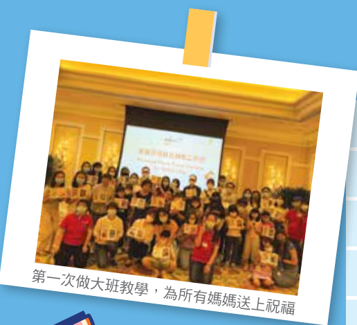
第一次做大班教學，為所有媽媽送上祝福