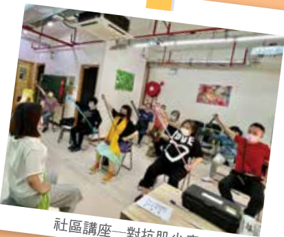
社區講座—對抗肌少症