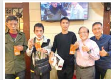
新年大抽獎，迎接牛年