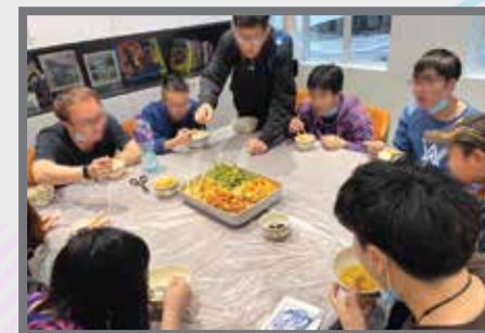
YUM！一齊整湯圓同嘆下午茶～