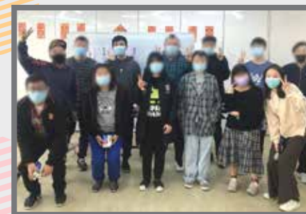
HELLO！初次見面，請多指教～