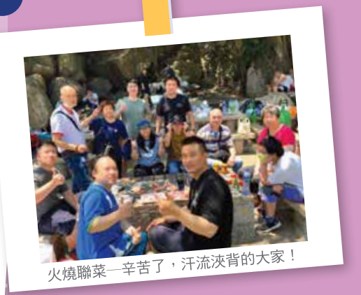
火燒聯菜—辛苦了，汗流浹背的大家！