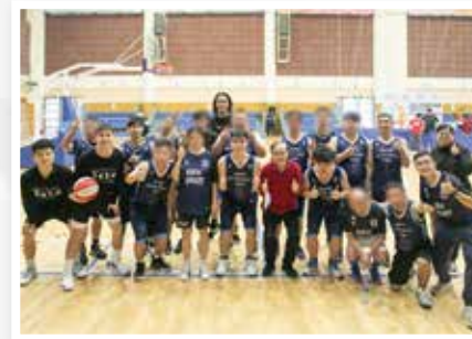
籃球隊與微辣霍哥合照