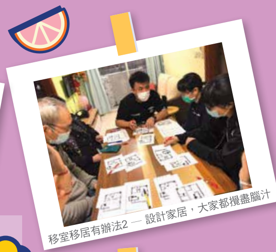
移室移居有辦法2 — 設計家居，大家都攞盡腦汁