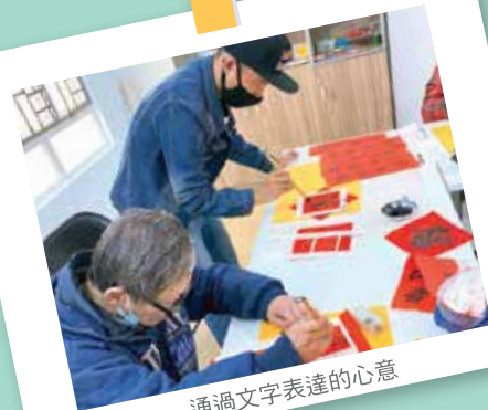
通過文字表達的心意