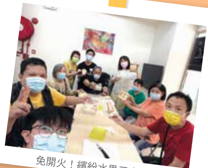
免開火！繽紛水果三文治