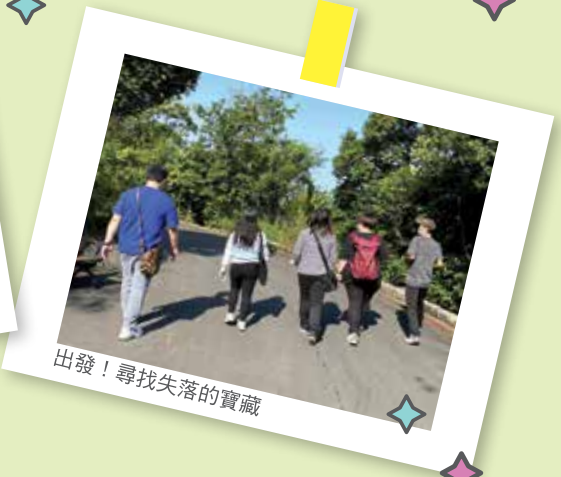
出發！尋找失落的寶藏