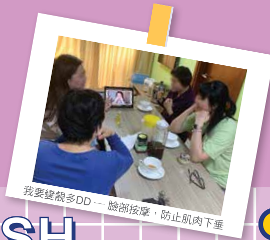
我要變靚多DD — 臉部按摩，防止肌肉下垂