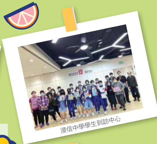
浸信中學學生到訪中心