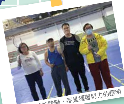
每支球拍獎勵，都是握著努力的證明