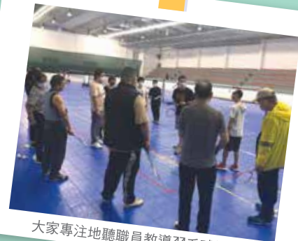
大家專注地聽職員教導羽毛球技巧