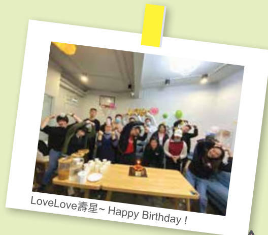
LoveLove壽星~ Happy Birthday!