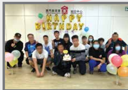
人人牛一，永不落空！