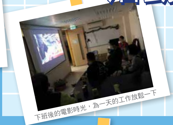
下班後的電影時光，為一天的工作放鬆一下