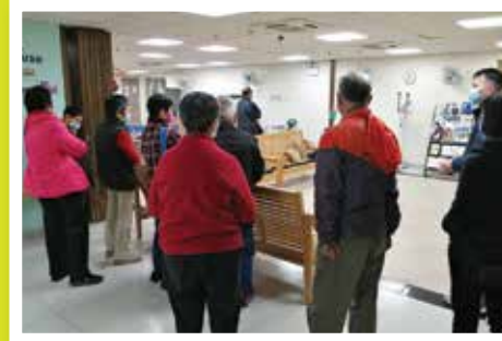
參觀宿舍服務單位