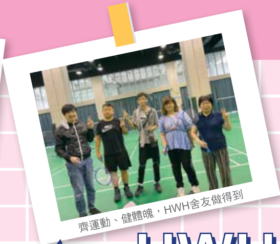
齊運動、健體魄，HWH舍友做得到