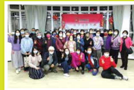
新春佳節喜氣洋洋