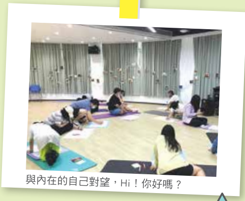
與內在的自己對望，Hi！你好嗎？