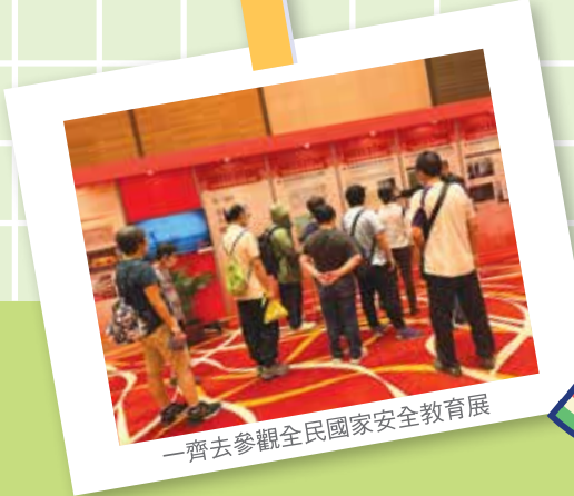
一齊去參觀全民國家安全教育展