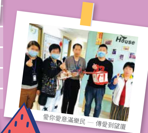
愛你愛意滿樂民 — 傳愛到望廈