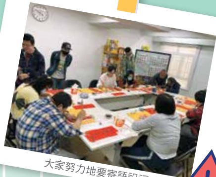
大家努力地要寄語祝福