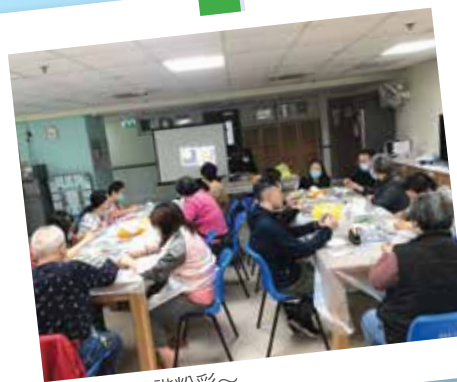
一起學習和諧粉彩~