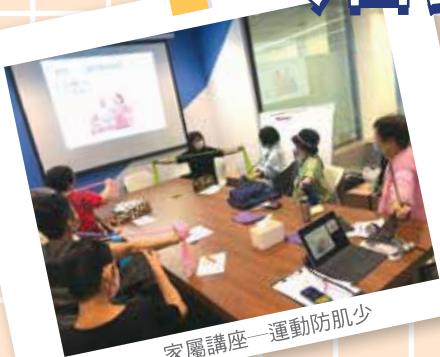
家屬講座—運動防肌少