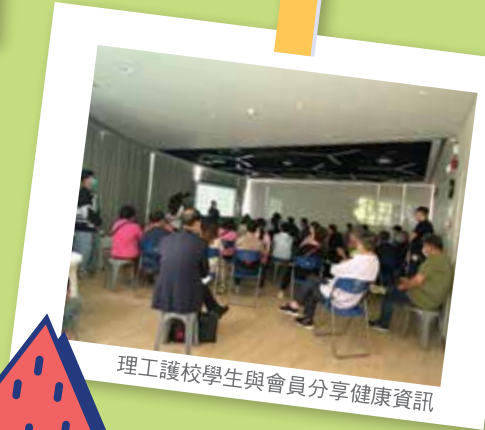
理工護校學生與會員分享健康資訊