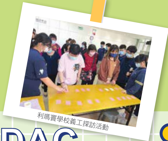
利瑪竇學校義工探訪活動