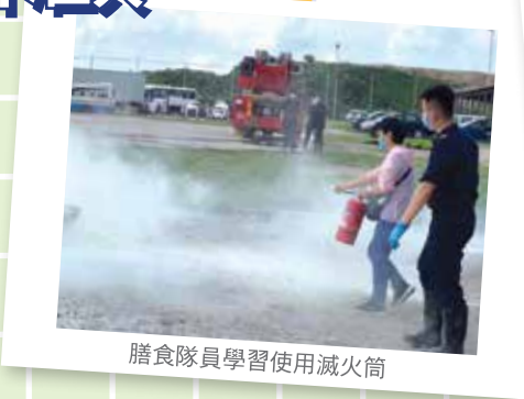
膳食隊員學習使用滅火筒