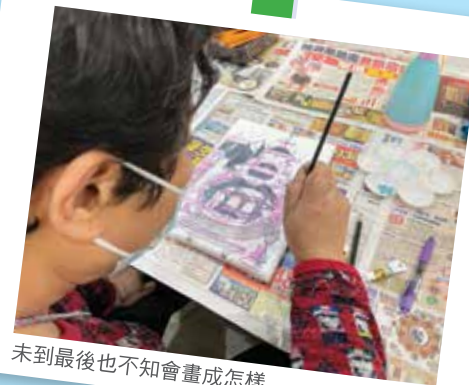
未到最後也不知會畫成怎樣