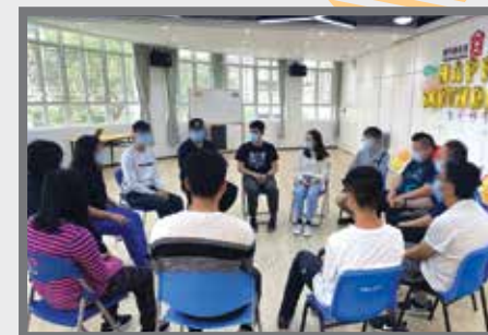
一齊用遊戲方式認識全新的中心～