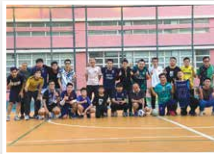
與救世軍朋友友誼賽