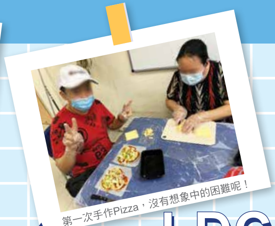
第一次手作Pizza，沒有想象中的困難呢！