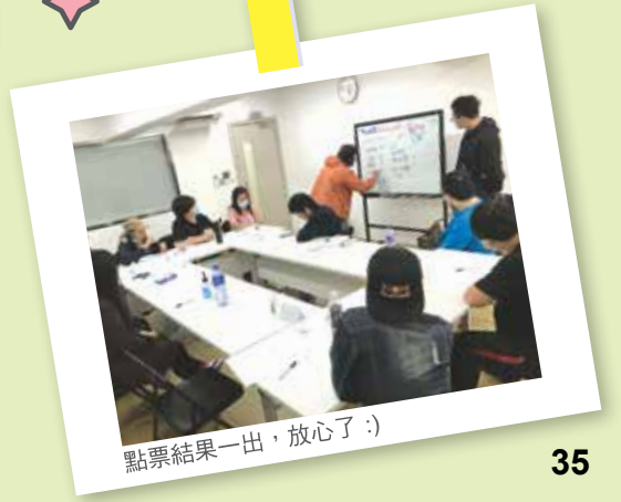
點票結果一出，放心了：)