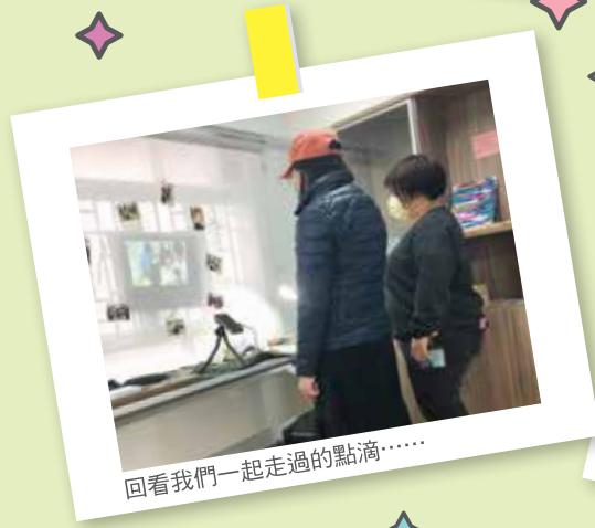
回看我們一起走過的點滴……