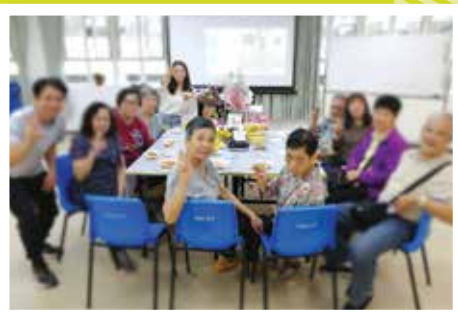
春日之親親野餐樂悠遊