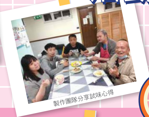
製作團隊分享試味心得