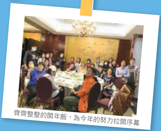
齊齊整整的開年飯，為今年的努力拉開序幕