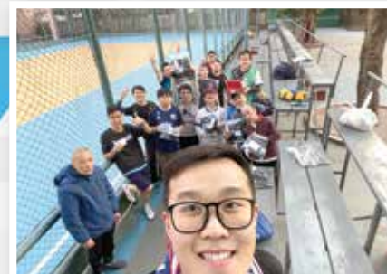
星期六的訓練，多謝教練的禮物及蛋糕