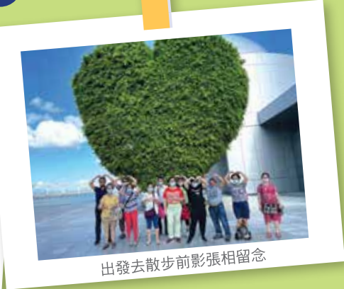
出發去散步前影張相留念