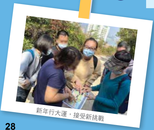
新年行大運，接受新挑戰