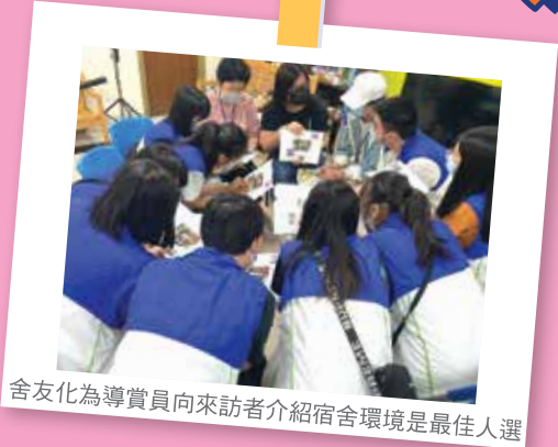
舍友化為導賞員向來訪者介紹宿舍環境是最佳人選