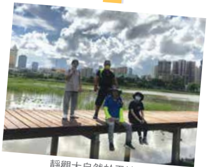
靜觀大自然於天地間