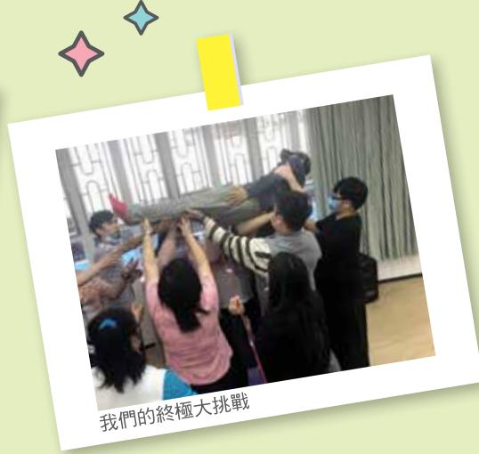
我們的終極大挑戰