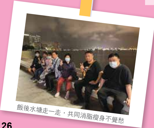
飯後水塘走一走，共同消脂瘦身不覺愁