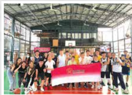
利民會同事、服務使用者與義工同場競技