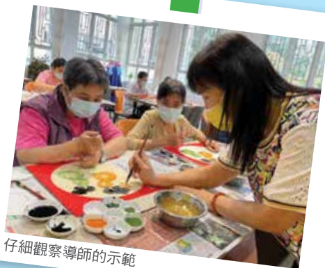
仔細觀察導師的示範

不論那位職員、那個機構或學校舉辦的藝術課程／小組，只要你有參與任何藝術類學習，並合乎條件，即可申請學習費用資助！ (詳情請參閱宣傳海報和活動章程)