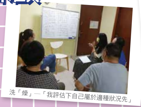
洗「燥」—「我評估下自己屬於邊種狀況先」