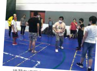
練習在場區內移動方法—跨步