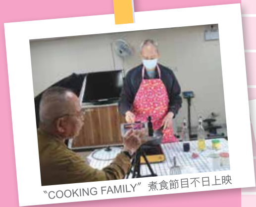
“COOKING FAMILY” 煮食節目不日上映